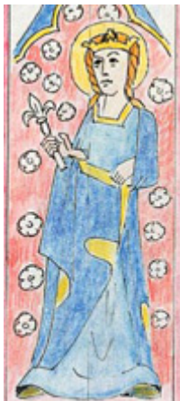
HEDWIG v. SCHLESSEN

Brigitta , geboren 1303 in Finstaed bei Uppsala, entstammte schwedischem Hochadel, wurde als Kind tief beeindruckt durch eine Predigt über die Leiden Christi, den sie in der Nacht darauf am Kreuz hängen sah. Solche und andere Visionen hatte sie ihr Leben lang und diktierte sie in schwedischer Sprache ihrem Beichtvater. Nachdem sie Witwe geworden war ihr Mann war Richter über Ostgotland gewesen öffnete sie sich ganz dem Ruf, den sie immer wieder vernahm: Ich will durch dich in der Welt bekannt werden. Sie empfand sich als Braut Christi und scheute sich auch nicht vor den Großen der Welt weiterzusagen, was sie in ihren Visionen erfuhr. So mahnte sie den Papst zur Rückkehr nach Rom und gründete schließlich einem ihrer Gesichte folgend in Wadstena ein Frauenkloster. Zu diesem Stammkloster gehörten bald 79 Klöster des Birgittenordens. In der Regel, die sie gab, gebot sie Einfachheit im Kirchbau, Schlichtheit im Gottesdienst und an jedem Sonn und Feiertag Predigt in der Landessprache. Ihr ständiges Gebet war: Weise mir Herr, deinen Weg und mache mich willig, ihn zu gehen. Sie starb in Rom am 27. Juli 1373