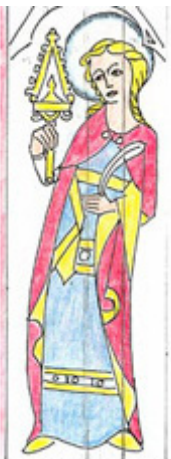
GERTRUD VON HELFTA